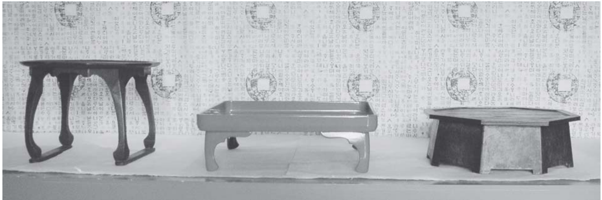
* 「小盤」(高麗美術館所蔵) * 「銘々膳」・「茶菓床」(筆者所蔵)