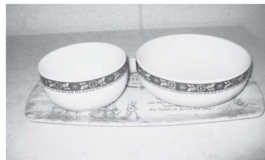
< B >筆者所蔵

【写真2】 < A >は真鍮で作った伝統的なもので左が「バップゴロツ」(茶碗)、右が「グックゴロツ」(椀)である。< B >は今日、よく使われている瀬戸物の「バップゴロツ」(左)と「グックゴロツ」(右)である。この器の変遷であるが、朝鮮時代以来、真鍮の器を使ってきたが、植民地時代以降はステンレス製に変わり、最近では瀬戸物がよく使われるようになった。< A >の左のように、一般的に「バップゴロツ」には材質に関わらず、蓋がついている。